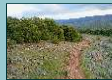
Cañada Real de las Merinas

San Blas, patrón de la localidad, tiene su ermita del siglo XVI sobre un emblemático cerro donde, en los primeros días de febrero, se organiza una gran fiesta y romería. Muy cerca se pueden visitar una antigua mina de hierro a cielo abierto de origen desconocido que pudo ser explotada hasta principios del siglo XX.