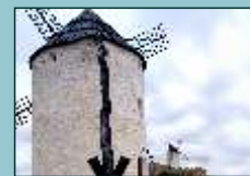
Molino del Tío Zacarías