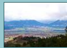
Panorámica del Valle del Algodor